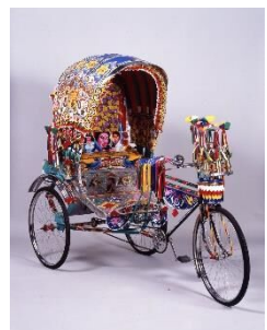
アハメッド他 「リキシャ」1994年 福岡アジア美術館蔵